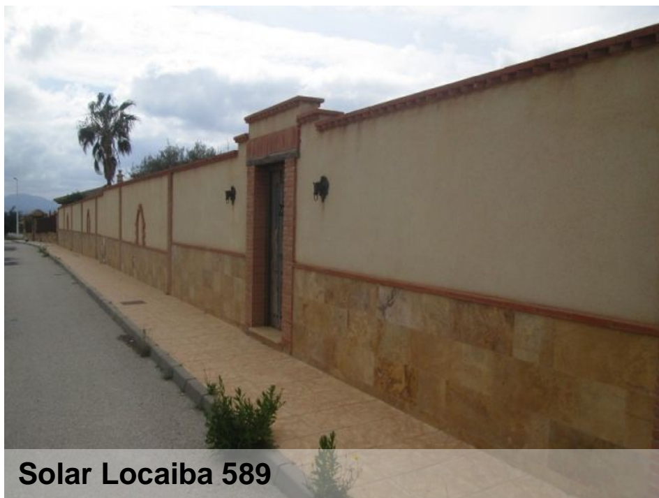
Solar Locaiba 589