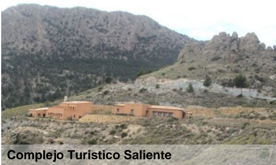
Complejo Turístico Saliente