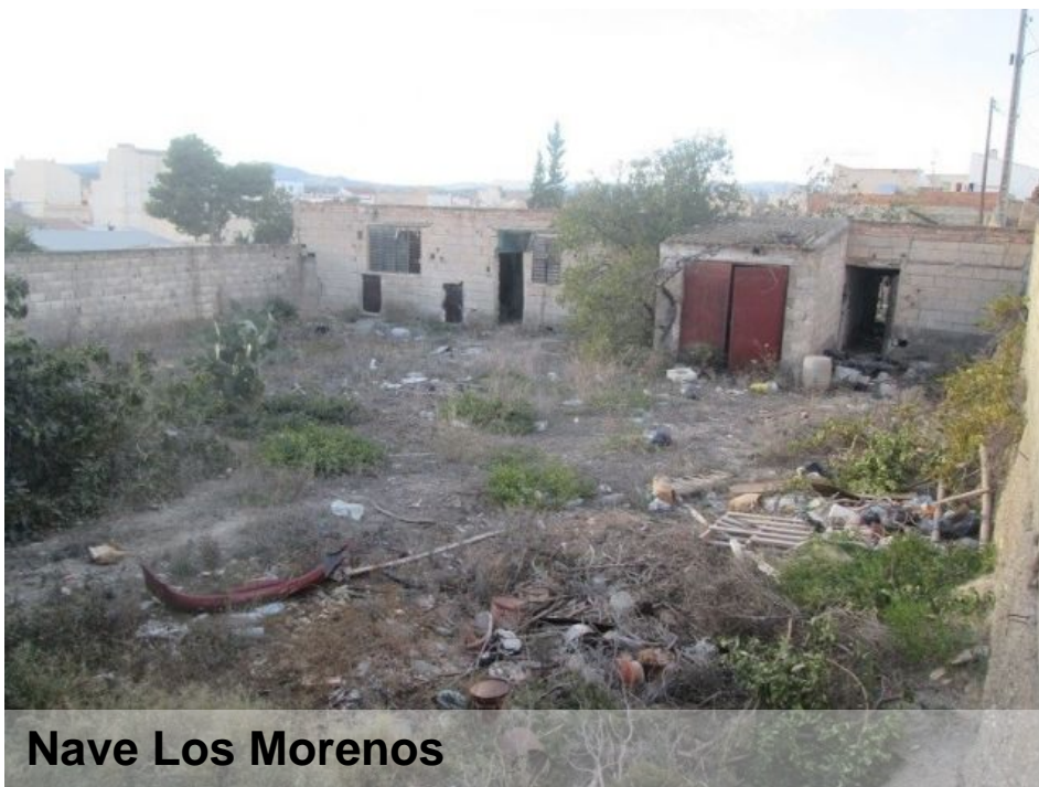
Nave Los Morenos