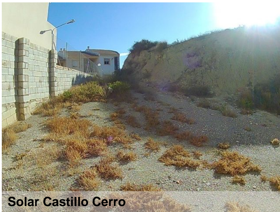
Solar Castillo Cerro