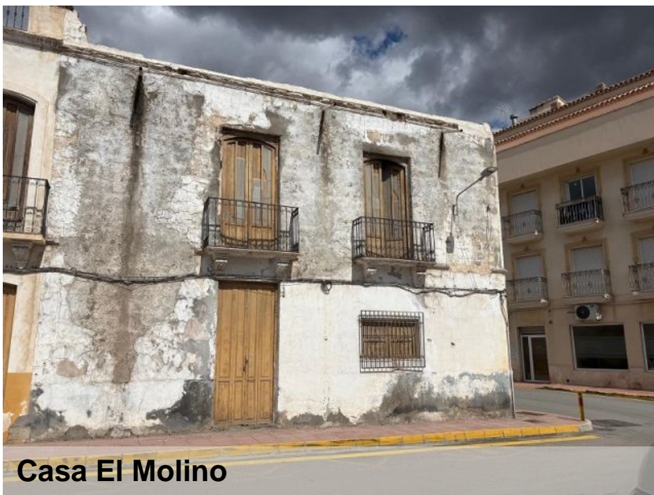
Casa El Molino